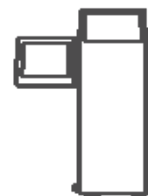
nmQuiosco Dual 2