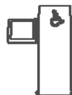
nmQuiosco Dual 1